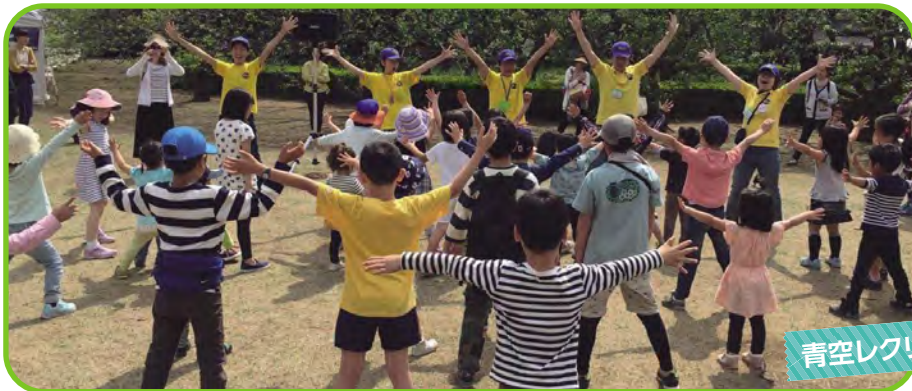
青空レクリエーション

小学館レクリエーションリーダーズクラブは、1981年に設立され、 様々な事業や イベントの企画・運営・実施を行なっています。 ミュージカルや手品などの舞台活動や広場遊びなどの レクリエーション活動、キャンプ活動を通した トータルレクリエーションリーダーの育成を行っています。