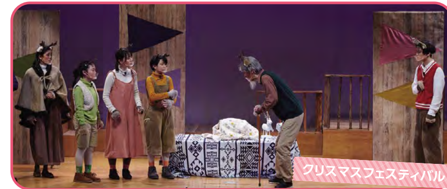
クリスマスフェスティバル

小学館レクリエーションリーダーズクラブは、1981年に設立され、 様々な事業や イベントの企画・運営・実施を行なっています。 ミュージカルや手品などの舞台活動や広場遊びなどの レクリエーション活動、キャンプ活動を通した トータルレクリエーションリーダーの育成を行っています。