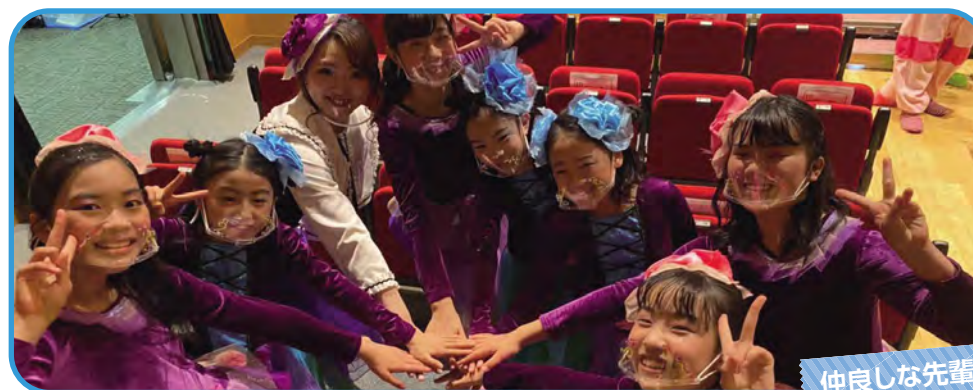
仲良しな先輩・後輩