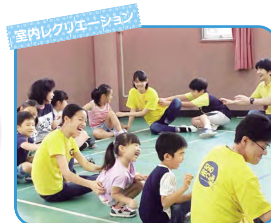
室内レクリエーション